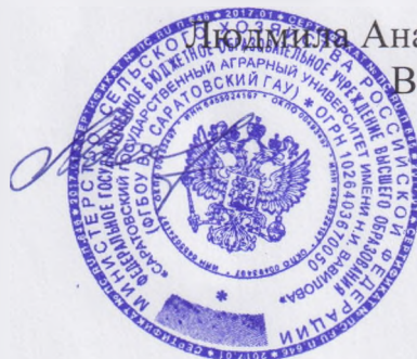
Подпись Анастасии Волощук