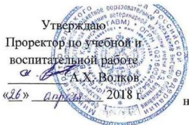
График учебного процесса (заочная форма)

Федеральное государственное бюджетное образовательное учреждение высшего образования «Казанская государственная академия ветеринарной медицины имени Н.Э. Баумана»