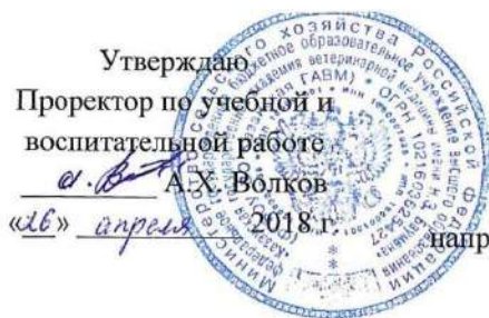
График учебного процесса (очная форма)

Утверждаю Проректор по учебной и воспитательной работе