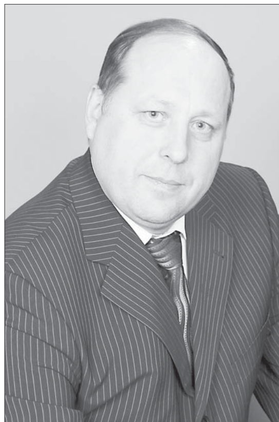
Галимзян Фазылзянович Кабиров

Ректором академии на новый срок избран Г.Ф. Кабиров