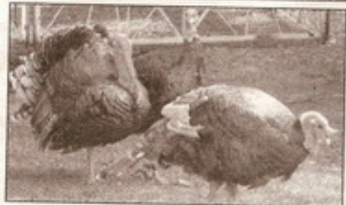
Новоселы наших птицеводов.