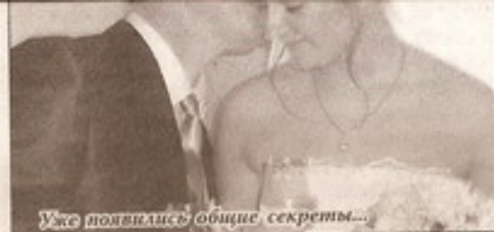
Уже появились общие секреты...

Не раз мы слышим шутку: «Сдал анатомию – можно жениться!», «Сдал план случек и опоросов – женись!», «Пережила третий курс – пора и замуж!». Но у одной