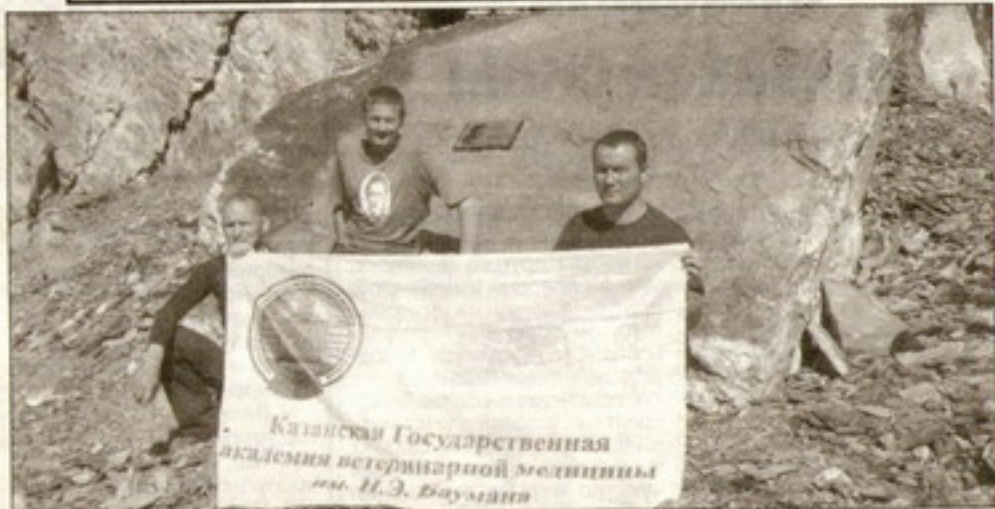
Знамя академии взвилось до облаков.