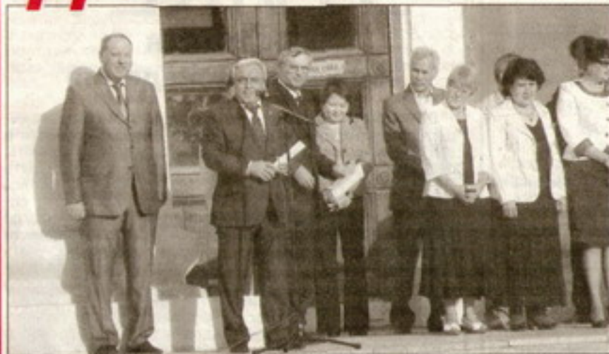
Выступление ректора академии 1 сентября на торжествах по поводу Дня знаний

Дорогие преподаватели, сотрудники, аспиранты и студенты академии! Дорогие первокурсники!