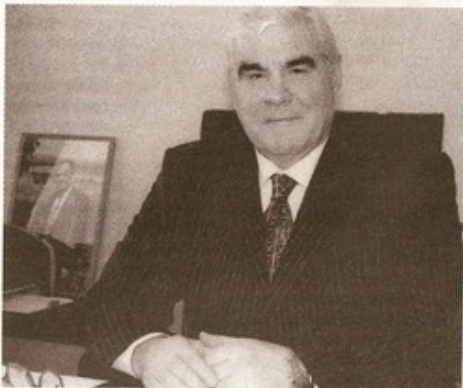
строка в трудовой книжке – ветврач совхоза «Бишининское» активное участие в разработке инвестиционно-иннова-